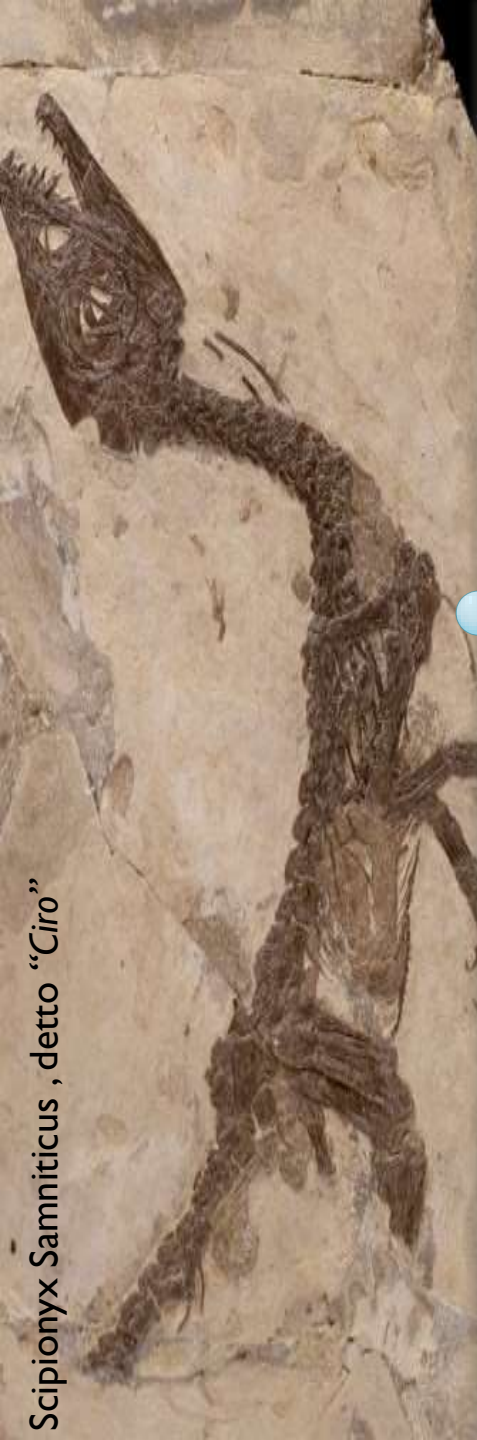
Scipionyx Samniticus , detto "Ciro"

Un interessante tour in una terra meravigliosa alla scoperta della magica città di Benevento - da poco inserita nella lista dei patrimoni UNESCO - di Montesarchio con la visita del Museo Archeologico Nazionale del Sannio Caudino, e Sant'Agata dei Goti, uno dei borghi più belli ed affascinanti d'Italia.