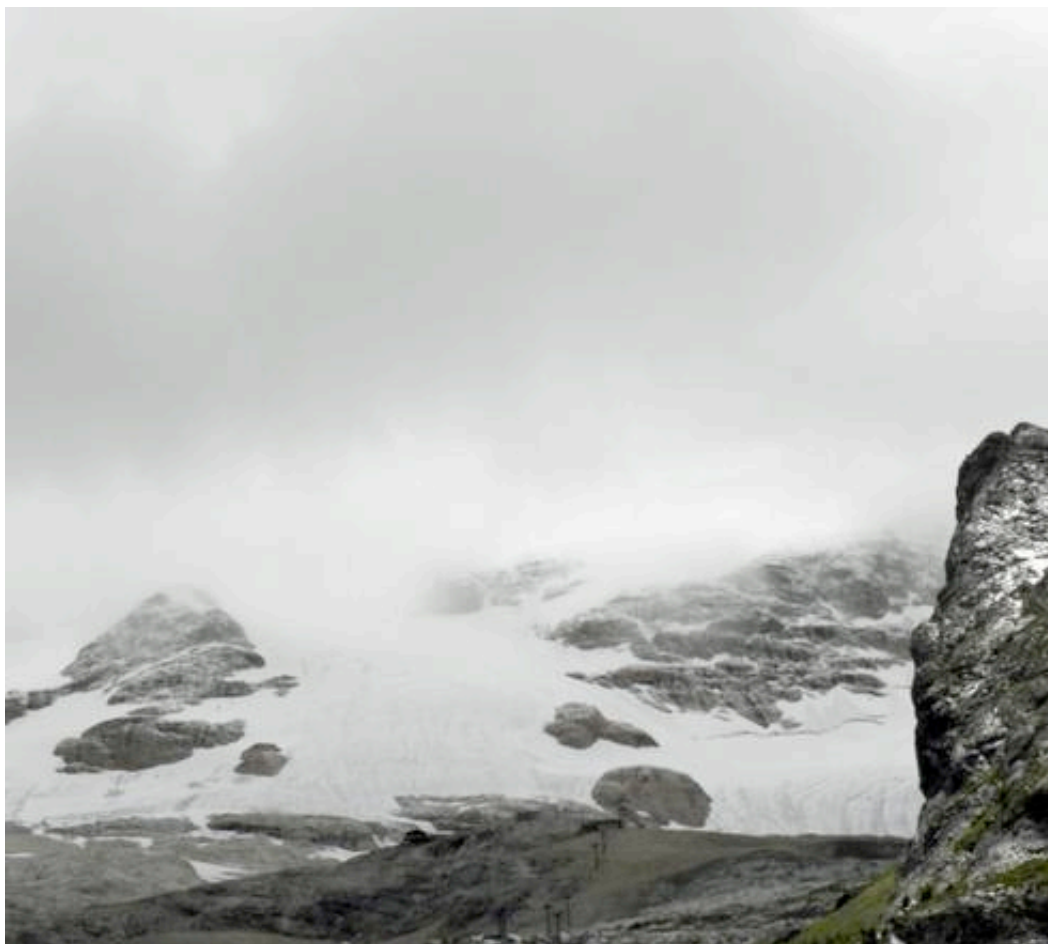
Museo scienze Trento, 'Settimana Terra'