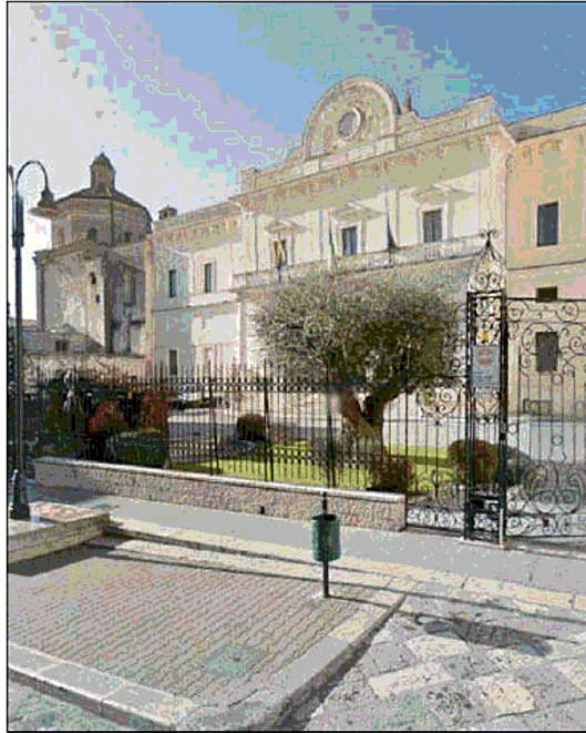
Il municipio di Gravina in Puglia